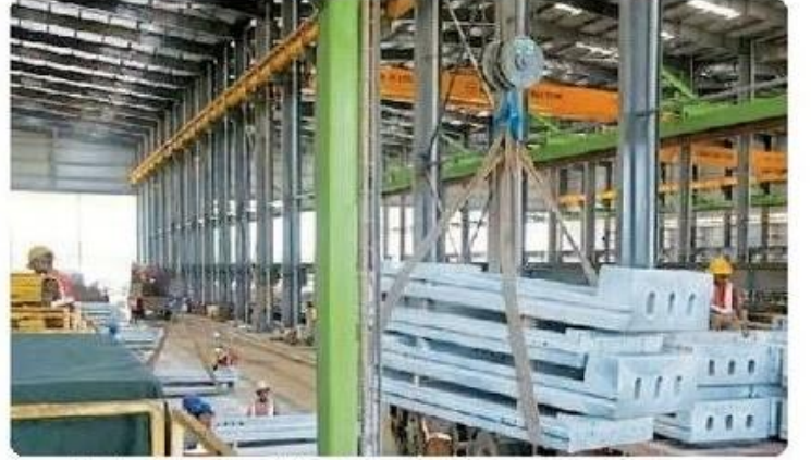
सूरत में प्री-कास्ट नॉइज बैरियर्स फैक्ट्री