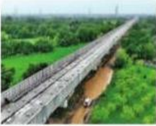
નવગુજરાત સમય > સુરત

■ બુલેટ ટ્રેનના મુસાફરોને સામાન્ય ટ્રેન દોડે ત્યારે જે ઘોંઘાટ સંભળાય તે નહીં લાગશે. બુલેટ ટ્રેન પ્રોજેક્ટના આગળ ધપી રહેલા કામમાં અવાજના અવરોધને દૂર કરવા માટે નોઈઝ બેરિયર લગાવાય રહ્યાં છે. બુલેટ ટ્રેનના વાયડક્ટ પર 1,75,000 થી વધુ અવાજને અવરોધતા નોઈઝ બેરિયર કે જે કોંક્રિટની જ બે મીટર ઊંચી પેનલ હોય છે, તે લગાવી દેવાયા છે. આવા બેરિયર 560 કિલોમીટર લંબાઈમાં આખા કોરિડોર ઉપર લાગશે. ટ્રેકની બંને તરફ લાગનારી કોંક્રિટની પેનલના આ નોઈઝ બેરિયરની ખાસિયત એ હશે કે તેનાથી ટ્રેનની અંદર બેસનારા પેસન્જર્સને બહારનું દ્રશ્ય જોવામાં અડચણ રૂપ નહીં બનશે.