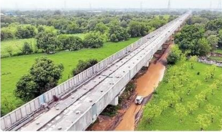
मुंबई-अहमदाबाद बुलेट ट्रेन वायडक्ट पर लगाए नॉइज बैरियर्स