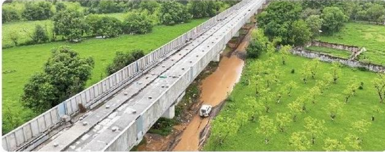
आणंद बुलेट ट्रेन स्टेशन के पास लगाए गए नॉइज बैरियर्स।

इन नॉइज बैरियर्स को परिचालन के दौरान ट्रेन और सिविल निर्माण से उत्पन्न होने वाले शोर को कम करने के लिए वायाडक्ट के दोनों ओर लगाया जा रहा है।